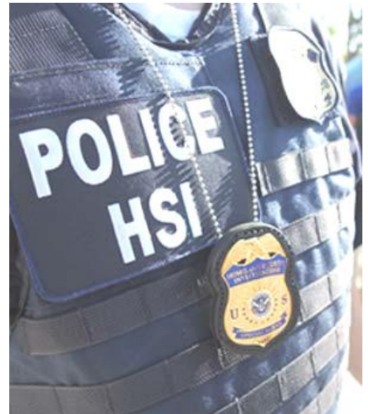
HSI = H omeland S ecurity I nvestigations